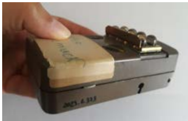
Récepteur haute fréquence utilisé à l'école années 1980

Elle nous a expliqué que dans le pire des cas, un restaurateur pouvait l'effacer.