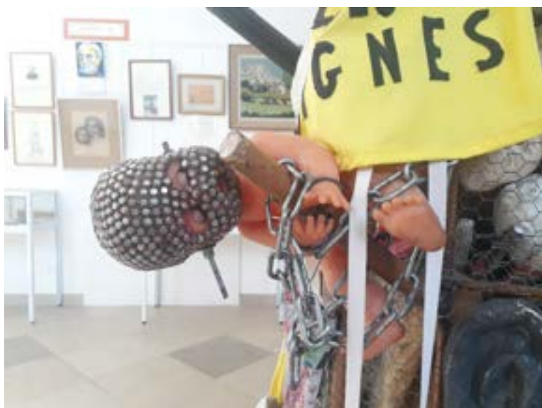
Détail du Totem, œuvre collective de l'ASTOLOSA 31 (association des Sourds de Toulouse) 2013