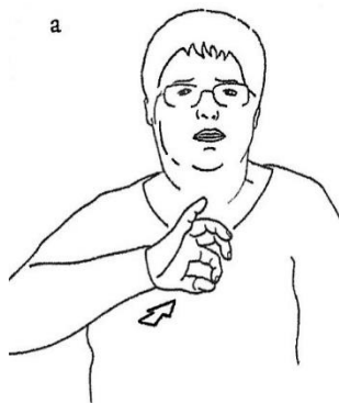
a. TOILETTES à Nogent-le-Rotrou. b. « Bois pipi ». Dessin YD d'après une photographie de Mitko Androv. Coll. INJS, Paris.

« Toilettes : Une main en pince arrondie, paume vers l'avant, est posée sur le milieu de la poitrine. Également en usage à Chambéry (1982 : F-8) avec le sens de « toilettes, pipi » d'où a dérivé le signe parisien URINER initialisé avec le double i de pipi (Delaporte, 2007 :608). Etymologie : ce signe représente la plaque de bois, appelé « bois pipi », que devait autrefois porter en pendentif tout élève autorisé à se rendre aux toilettes pendant les heures de classe. Son port dans les institutions comportant escalier et grands couloirs permettait à l'élève de justifier sa sortie de la classe au cas où il croiserait quelque membre du corps enseignant. L'école de Nogent-le-Rotrou étant beaucoup trop petit pour que cet emblème y ait été nécessaire, la présence du signe est donc due à un emprunt au lexique d'une autre institution, vraisemblablement celle du Bon-Sauveur de Caen ».