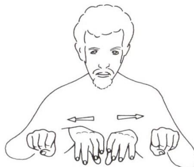
TRAVAILLER 2 (variante). Y.D. d'après Saint-Laurent-en-Royans 1979.