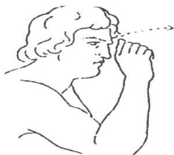
GARÇON 1. Lambert 1865 « homme ».

(Source : dictionnaire étymologique et historique de la langue des signes française, origine et évolutions de 1200 signes, Yves Delaporte, 2007, page 264,265).