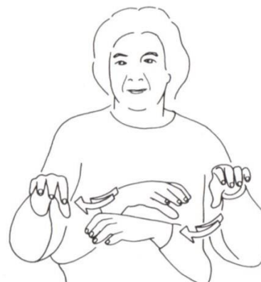
TRAVAILLER 2 (variante). Pont-de-Beauvoisin. Y.D.