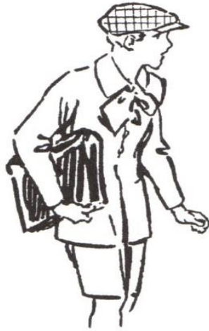
Dessin anonyme, Pierrot , 1928.

Yves Delaporte - Dictionnaire étymologique et historique de la langue des signes française