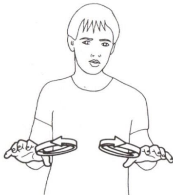
TRAVAILLER 2. © Ivry 1986.