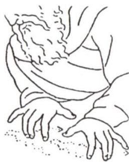
TRAVAILLER 2. Lambert 1865 « faire, agir, travailler ».

(Source : dictionnaire étymologique et historique de la langue des signes française, origine et évolutions de 1200 signes, Yves Delaporte, 2007, page 596).