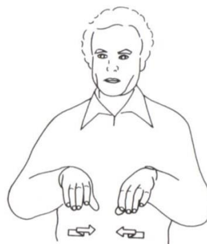
TRAVAILLER 2 (variante). Y.D. d'après Chambéry 1982.