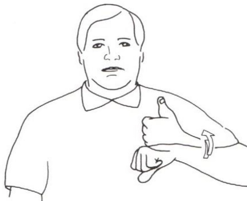
GARÇON 4. Y.D.