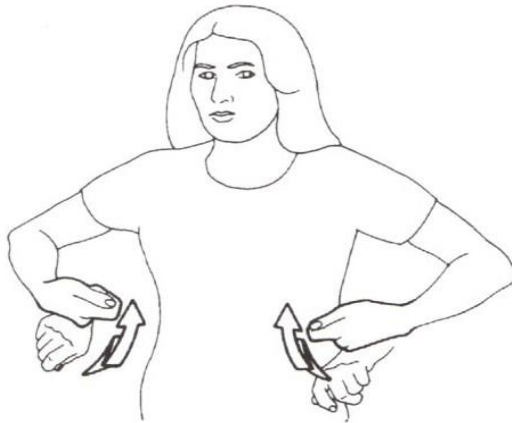
GARÇON 3. © Ivt 1986 « pantalon ».