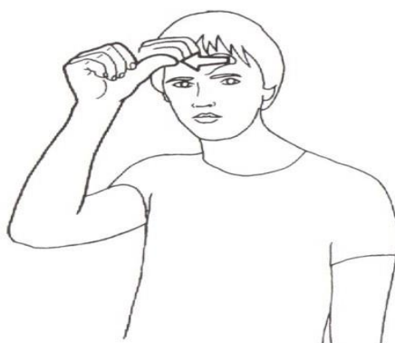
GARÇON 2. © Ivt 1986.