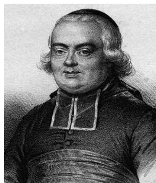
L'abbé de l'Épée

Charles-Michel de L'Épée , appelé abbé de L'Épée , né Charles-Michel Lespée le 24 novembre 1712 à Versailles et mort le 23 décembre 1789 à Paris (Paroisse Saint-Roch), il est un prêtre français, l'un des précurseurs de l'enseignement spécialisé dispensé aux sourds. Il la destine à des enfants pour la plupart issus de familles pauvres. Il établit une école informelle à Paris pour les jeunes sourds à partir des années 1760.