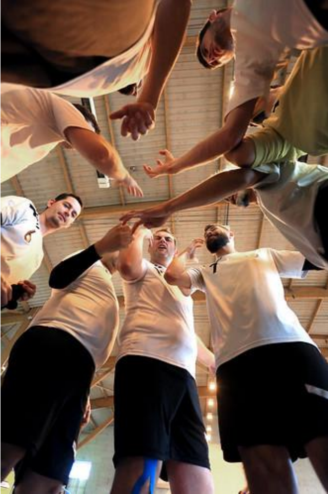
Huddle finale de coupe de France de Handball Sourd, Club de Limoges, 2019