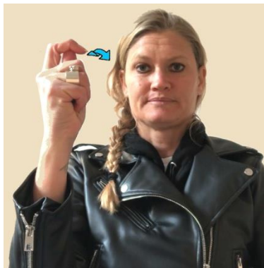
Le signe AOUT à Bordeaux.

AOUT. Représente peut-être une feuille de laurier formant la couronne posée sur la tête des meilleurs élèves pendant la distribution des prix qui, au 19 e siècle, se déroulait au mois d'août. Cette hypothèse n'est pas entièrement convaincante en raison de la forme de la main en « clé », mieux adaptée à la tenue d'objets minces/ou souples, et au mouvement qui, dans d'autres signes issus de la couronne de lauriers, longe le front. Sinon, il faudra chercher du côté des activités agricoles du mois d'août, notamment la moisson.