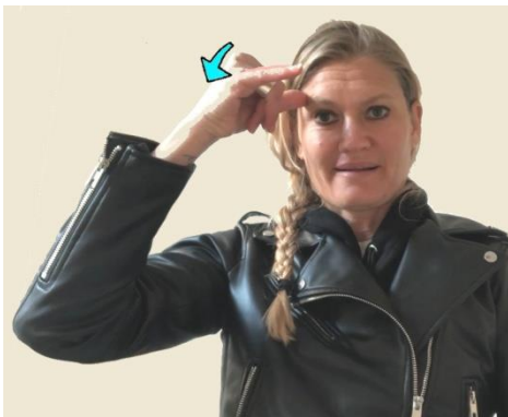
PIPI à Bordeaux : début et fin du signe.

TOILETTES. La main présente la forme du « i » manuel, voyelle qui apparaît deux fois dans le mot pipi et dont l'équivalent dans l'alphabet manuel est également présent dans le signe parisien PIPI. A Bordeaux, le signe est remonté sur le front, soit par euphémisme, soit parce que quelque chose de rond, ici l'abdomen, est fréquemment représenté par la tête, là où le lieu d'émission de l'urine se trouvera proche de l'œil (qui, à Bourg-la-Reine, au Portugal et certainement ailleurs, représente la vulve) et du nez (qui représente le pénis dans de nombreuses localités), soit pour tout cela en même temps. Cette hypothèse est confirmée par le petit mouvement arqué vers l'avant qui représente le jet urinaire.