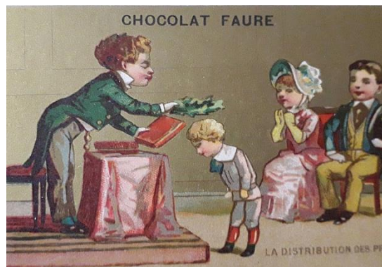
La couronne de laurier posée sur la tête d'un bon élève.