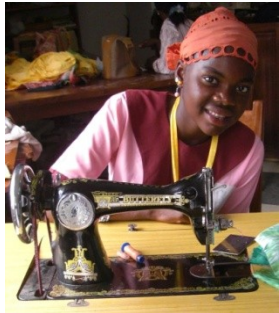
⇨ La couture