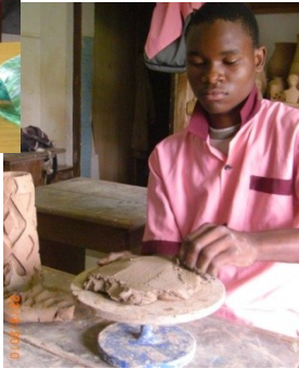
La poterie ⇨